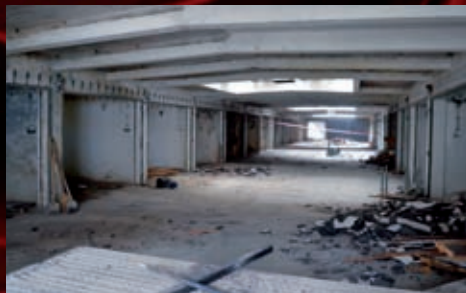
Již nepoužitelná stavba zabírala důležité místo, kde vyroste budova nová.