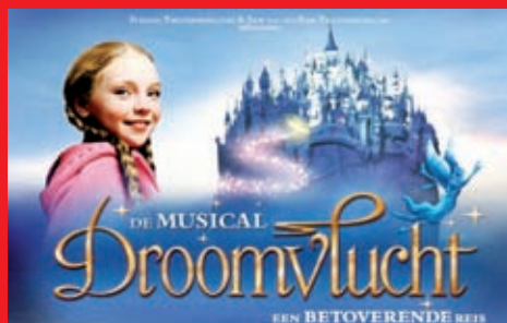
Původní plakát k holandské inscenaci