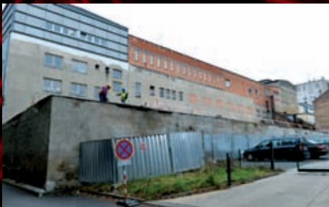
Do trosk starých garáží se v závěrečných dnech loňského roku vrhla parta stavitelů.