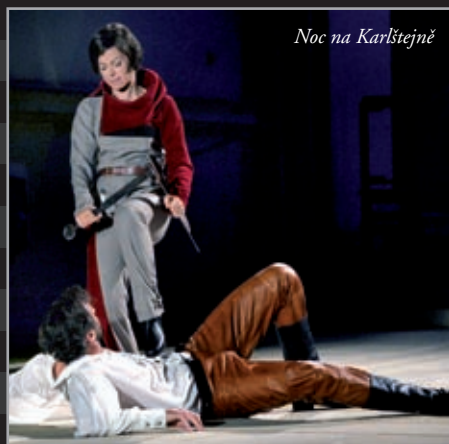
Noc na Karlštejně