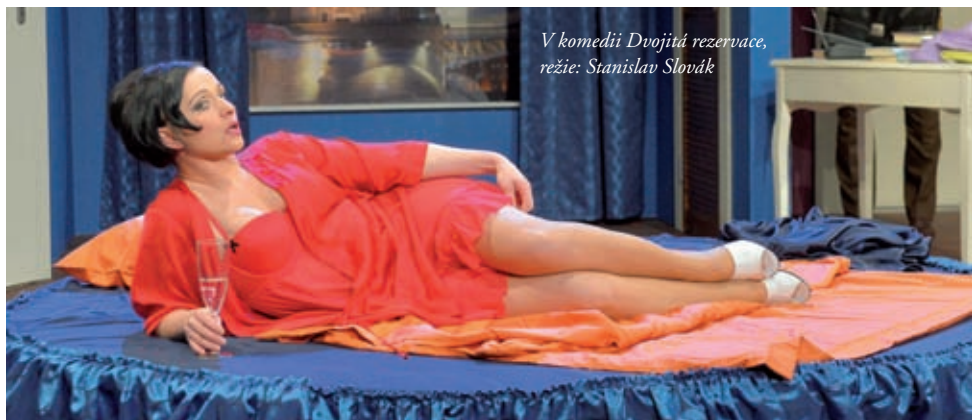
V komedii Dvojitá rezervace, režie: Stanislav Slovák

Všechny nové divadelní prostory se musí polidštit. I tady chvíli trvalo, než jsme se na jevišti a v zákulisí tohoto zprvu neosobního, i když krásného divadla zabydleli. Samozřejmě, že si každý herec musí dávat na jevišti hodně pozor. Na jezdící velké vozy, kulisy, mohlo by se cokoli stát. Když ale zkusíte hned od začátku, naučíte se pohyb kulisy, ostatně kluci technici nás taky upozorňují na bezpečí.