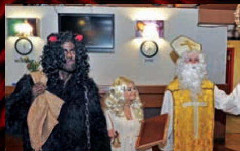
5. prosince se v Divadelním klubu zjevili Mikuláš, anděl a čert.