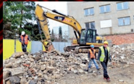
Připojila se i těžká technika a dnes už je vše uklizeno.