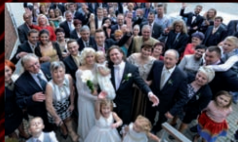
Pozvání přijali i přátelé z divadelního okruhu.