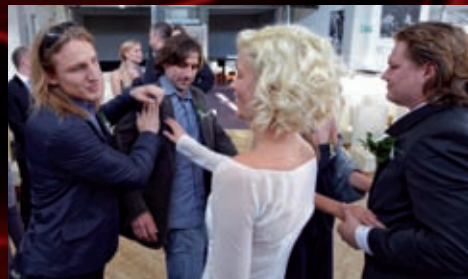
Svatba proběhla v hotelu Noem Arch.