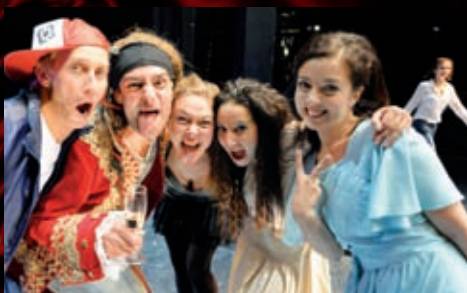
Často se fotografiemi budeme vracet k desetiletí Hudební scény.