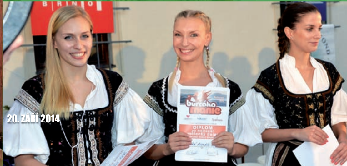
20. ZÁŘÍ 2014