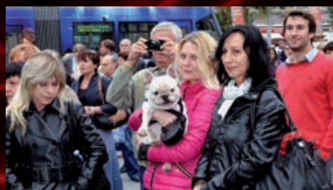
Akce se uskutečnila za hojné účasti kolegů z divadla a našich příznivců.