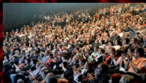
První uvedení muzikálu DUCH si prožili zaměstnanci a příznivci Tepláren Brno.