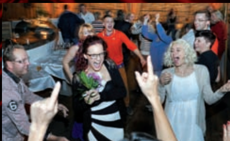
A svatební noc byla rušná a dlouhá.