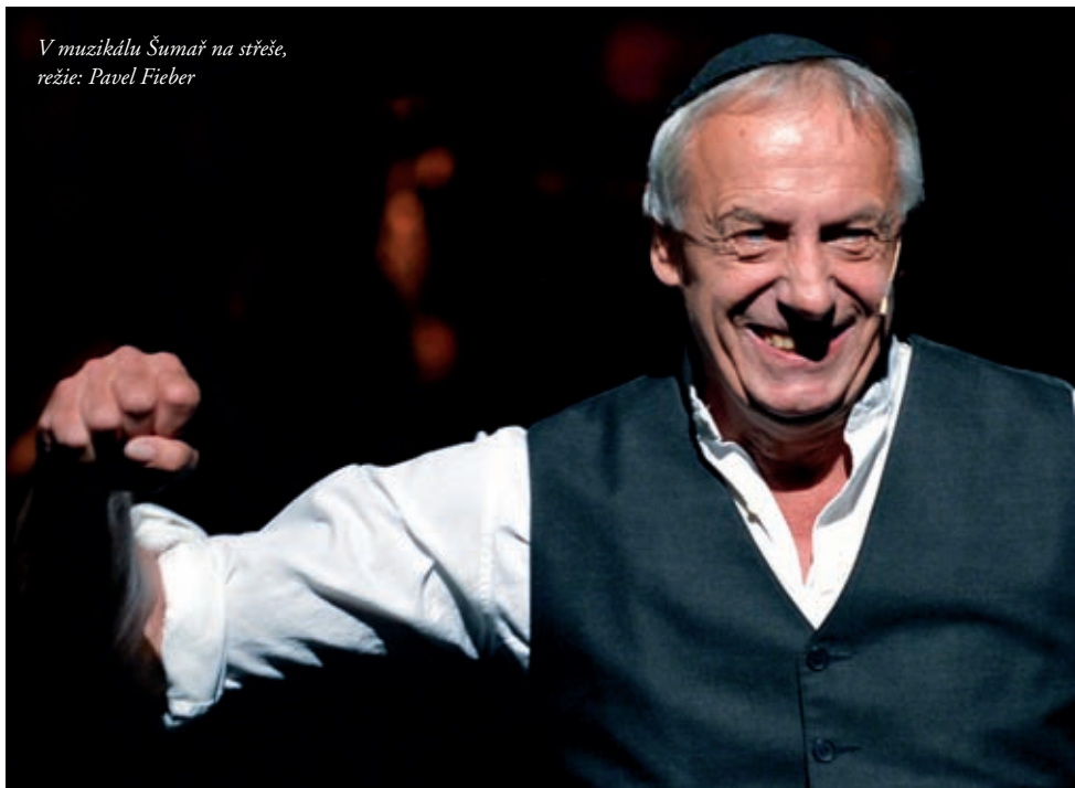
V muzikálu Šumař na střeše, režie: Pavel Fieber