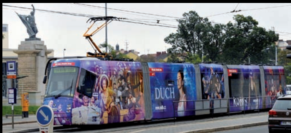
Design divadelní tramvaje Petr Hloušek.