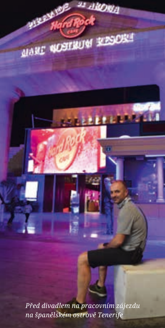
Před divadlem na pracovním zájezdu na španělském ostrově Tenerife

Když jsem v divadle začínal jako režisér, vypadala práce na svícení inscenací absolutně jinak, než je tomu dnes. Neodmyslitelnou součástí práce osvětlovačů byly žebříky a tyče... Pro každé jedno představení se totiž musely reflektory manuálně přenastavit a každá jedna světelná změna musela být zaznamenána do osvětlovacího pultu. Nalezení té správné světelné atmosféry pro jednu jedinou situaci někdy trvalo i hodiny. A to těch světelných změn někdy bylo i třeba tři sta. (Jako například naše legendární West Side Story , v níž jsme taneční číslo Cool – trvá asi šest minut – svítily přes ce-