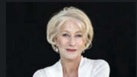
Helen Mirren: Poselství ke Světovému dni divadla 2021

„Tato doba je pro živá vystoupení velice nepřívznivá a řada umělců, techniků a mužů i žen za scénou i na scéně musí bojovat o přežití v oboru, který je již tak plný nejistoty.