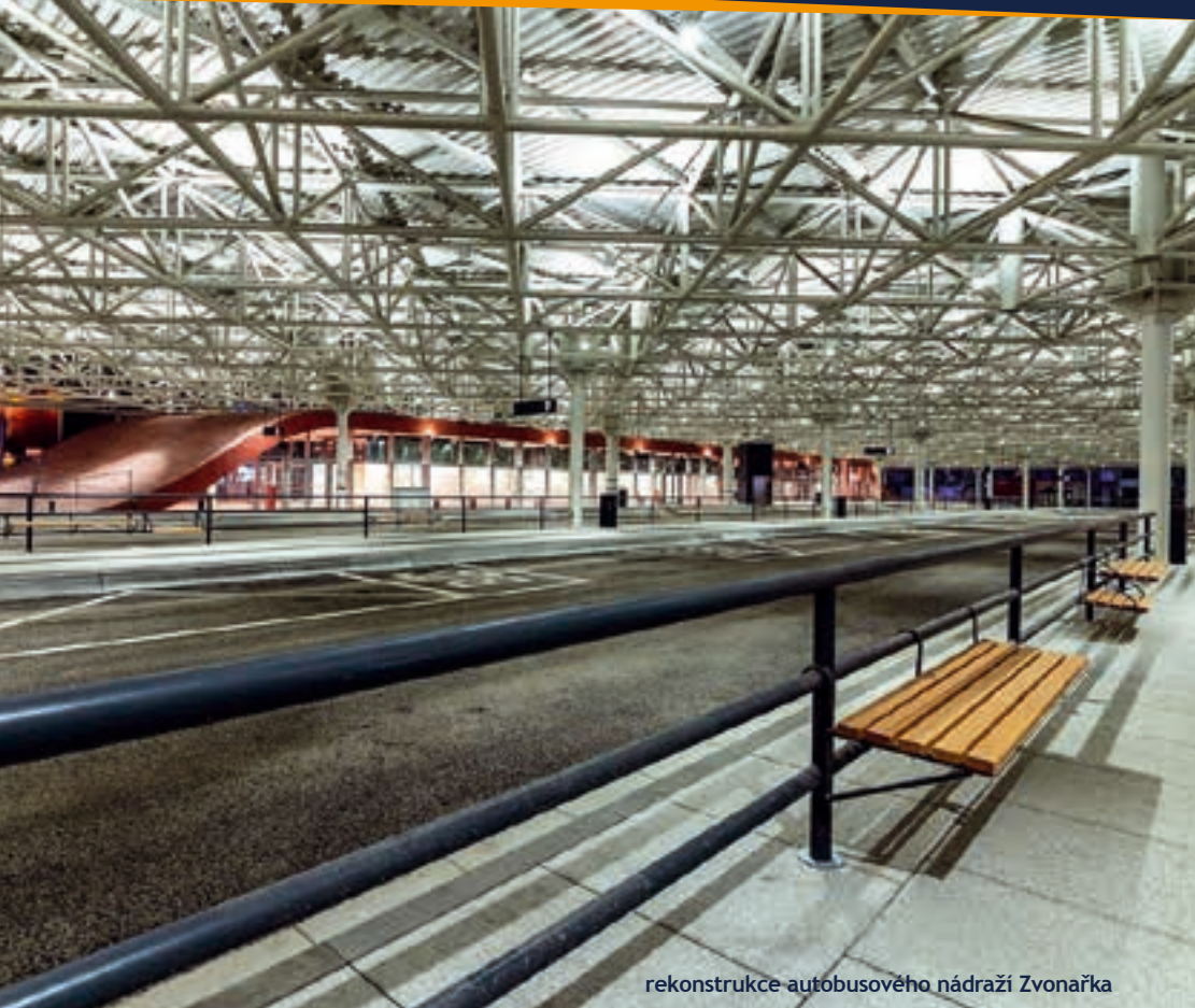
rekonstrukce autobusového nádraží Zvonařka