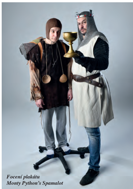
Focení plakátu Monty Python's Spamalot