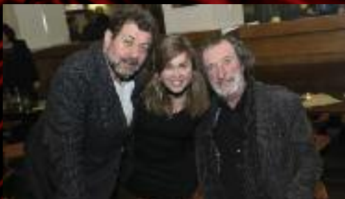
Zatímco jedna inscenace slaví premiéru (fotografie z premiéry Lakomce), ...