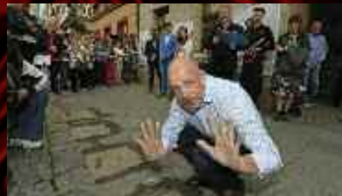
Dalším, kdo se do chodníku nesmazatelně vtiskl, byl herec Viktor Skála.