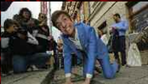
Do chodníku slávy zvěčnil otisky rukou také herec Aleš Slanina.