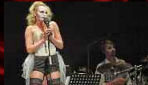
Na Činoherní scéně festivalu zabýjilo Divadlo v Dloubě inscenací Hovory na útrěku autora Bertolta Brechta.