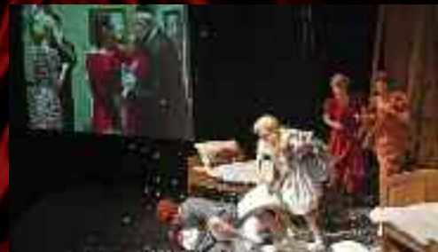
Hudební scéna v rámci festivalu hostila Slovenské národné divadlo s inscenací Fanny a Alexander.