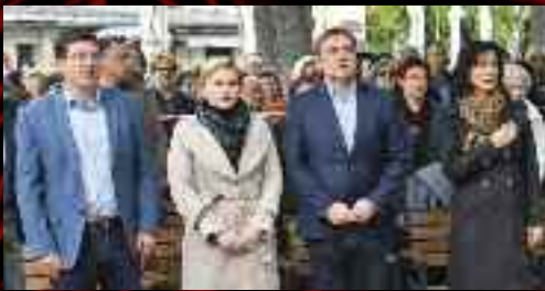
30. dubna se již potřinácté sešli Brňané v sadech Národního odboje, letos bylo setkání věnováno vzpomínce na občany Lidic a Ležáků.