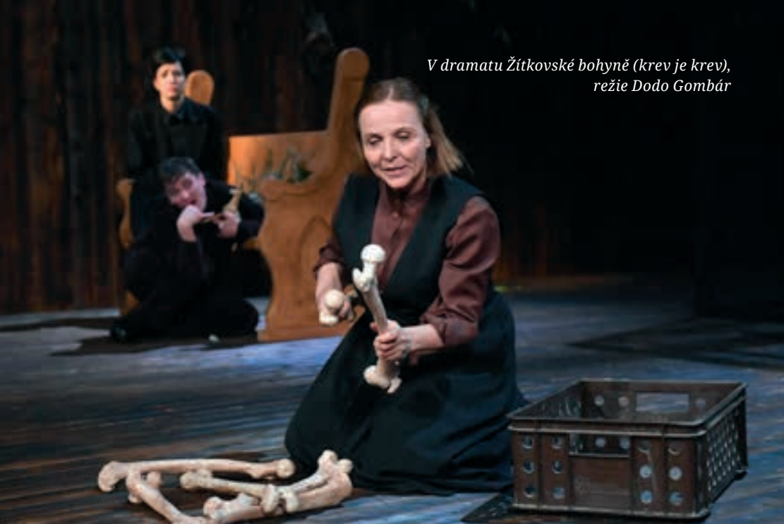
V dramatu Žitkovské bohyně (krev je krev), režie Dodo Gombár