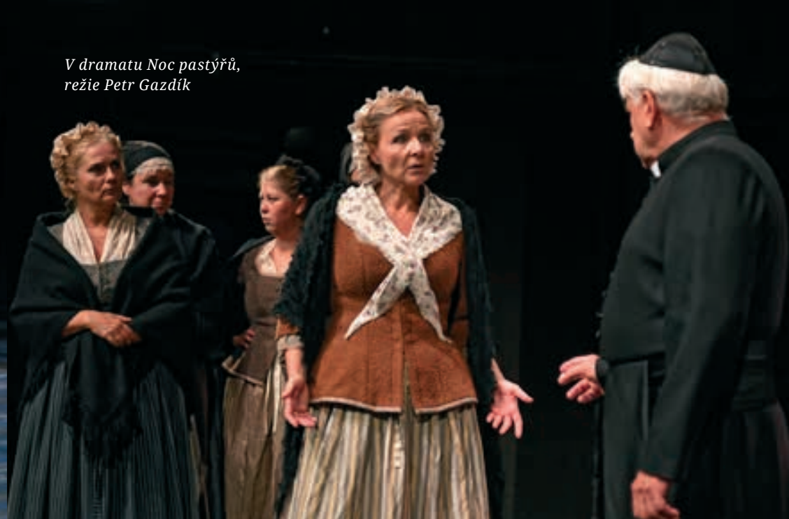
V dramatu Noc pastýřů , režie Petr Gazdík

Pod vedením domácích i hostujících režisérů jste tu během pěti let nasbírala (včetně zmíněných záskoků) úctyhodných osmnáct rolí, činoherních i muzikálových, dramatických i komediálních.