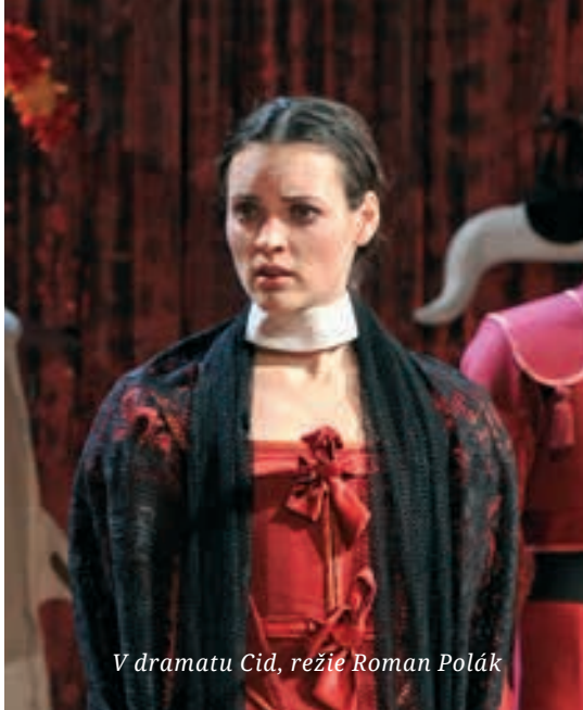
V dramatu Cid, režie Roman Polák

Evelína: Já na Cida hrozně ráda vzpomínám, protože to byla krásná práce, ale je mi někdy líto, že se tyto věci hrají tak málo. Ano, já vím, lidé mají radši komedie, protože dramata máme v životě mnoho a logicky se chtějí uvolnit a zlepšit náladu. A takové klasicistní drama člověku moc nepřidá. Když ale u těch komedií se člověk hrozně