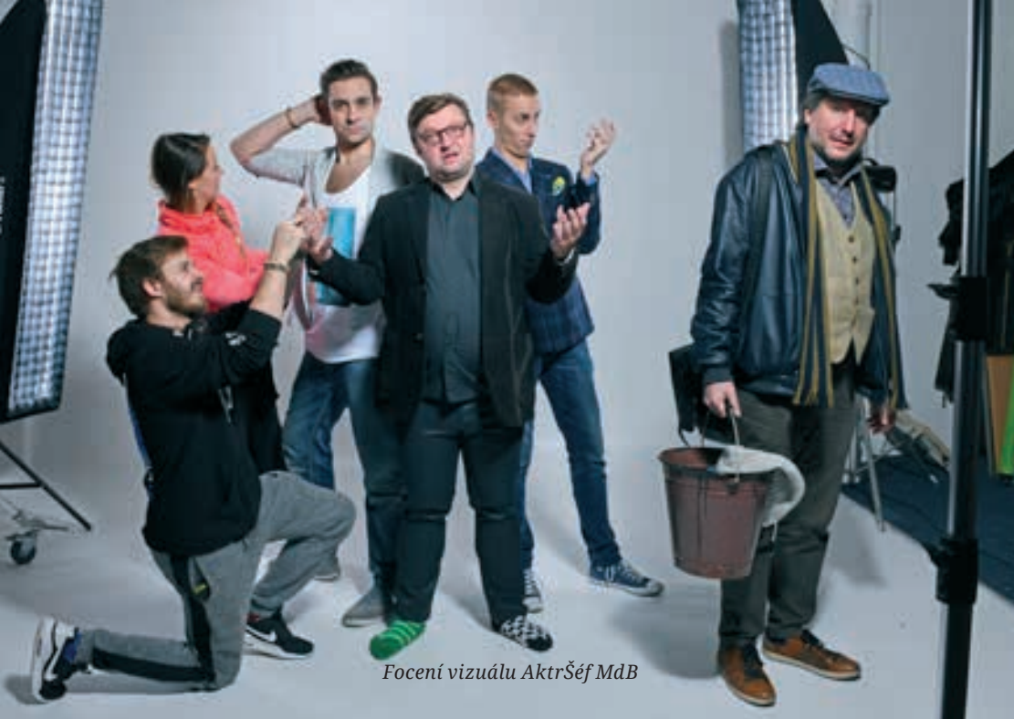
Focení vizuálu AktrŠéf MdB