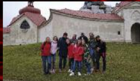
...zkontrolovat skutečné kulisy Zelené hory ve Žďáře nad Sázavou.