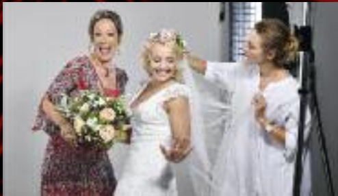
Svatební šaty pro plakát Mamma Mia! zapůjčil salon Naive.