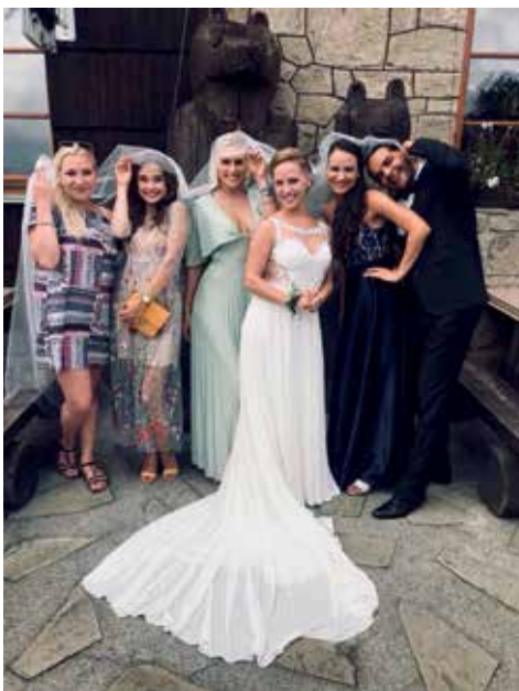
S Markétkou oslavili její krásný den i kolegové z divadla.