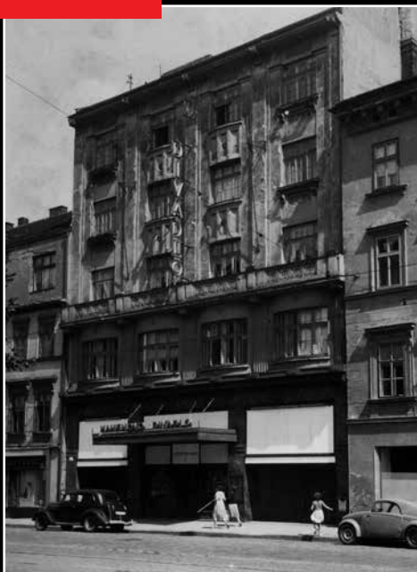
Mahenovo divadlo, Lidická 16, v roce 1957; od 1. srpna 1965 se stalo domovskou scénou Divadla bratří Mrštíků