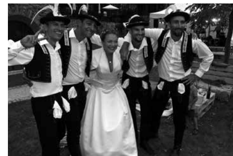
I Hanka si užila gratulace od kolegů z divadla.