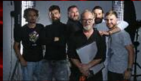
Inscenační tým Santinibo jazyka při focení plakátu.