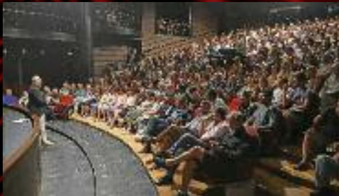
2. září jsme společně zabýjili novou sezónu.