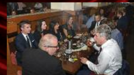
V klubu jsme se vzácnými hosty oslavili premiéru Žebrácké opery.