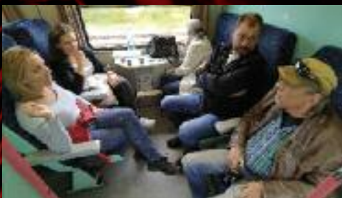
Kolegové ze Santinibo jazyka se reálně vydali...