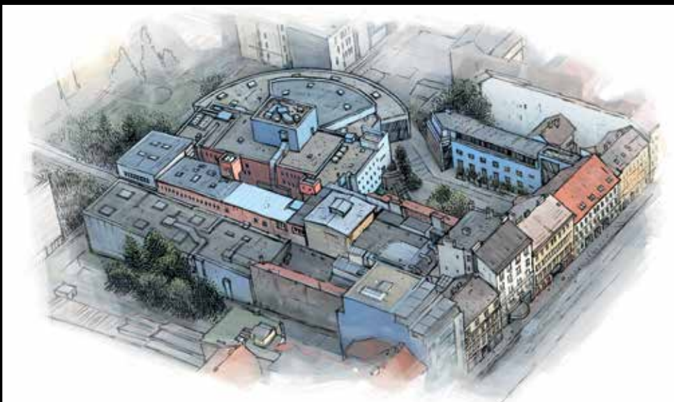
Areál Městského divadla Brno, současný stav

Městské divadlo Brno zahájilo 75. sezónu. Během let změnilo několikrát název i působiště. Začínalo jako Svobodné divadlo v květnu 1945 v budově Nového domova v ulici Falkensteinerově (dnes Gorkého); v srpnu 1947 se přestěhovalo do adaptovaných prostor bývalého tanečního sálu Družstva obchodních a průmyslových zaměstnanců (DOPZ) v Domě Jakub na Jakubském náměstí (dnes Divadlo Bolka Polívky). Tam (kromě vražedného zájezdového provozu) hrálo až do poloviny roku 1965 pod novými názvy: Městské a oblastní divadlo (1947–1950), Krajské oblastní divadlo (1950–1954), od 1. září 1954 Divadlo bratří Mrštíků (DbM). Pak přesídlilo do objektu někdejšího kina Metropol na Lidické 16, přestavěného pro potřeby Mahenovy činohry už v roce 1954, a zůstalo v něm dodnes. Mezitím se přejmenovalo na Městské divadlo Brno (1. června 1993) a jeho prostory prošly zásadní moderní rekonstrukcí (1995). Historii jeviště MdB završila novostavba Hudební scény, otevřená premiérou muzikálu Hair 1. října 2004.