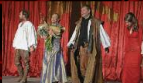
Léto na Biskupském dvoře jsme zakončili s kolegy z vinohradského divadla inscenací Lev v zimě.