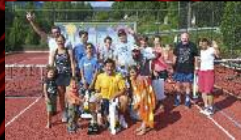
V penzionu Jiřinka na Dolní Moravě jsme se sešli za účelem sportovní... ...ale i muzicování.