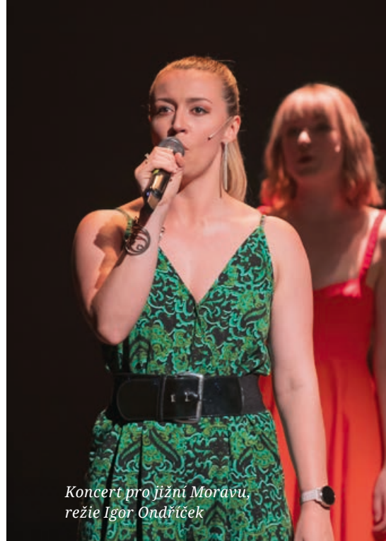
Koncert pro jižní Moravu, režie Igor Ondříček

Ještě před covidovou érou mi vzniklo dvou-denní volno, a tak jsem odletěla do Londýna na konkurz do pařížského Disneylandu na pozici performerky v muzikálových show v Disney pohádkách. Bylo to nesmírně troufalé, a když jsem pak v Londýně viděla tu obrovskou řadu nádherných holek, která stála před Pineapple Studiem, vůbec nic