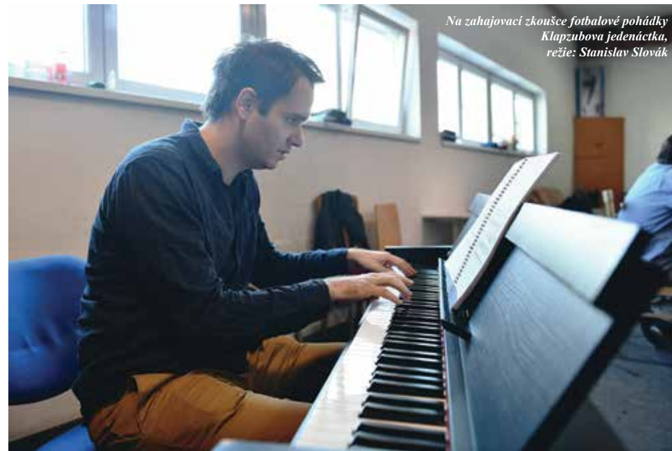
Na zahajovací zkoušce fotbalové pohádky Klapzubova jedenáctka , režie: Stanislav Slovák