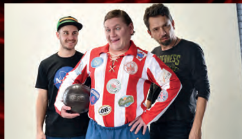
Nafotili jsme plakát pro Klapzubovu jedenáctku...