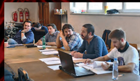
... a zabýjili jsme zkoušení této fotbalové pohádky.