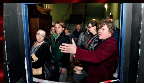
V rámci Noci divadel mohli diváci navštívit v doprovodu našich herců i zákulisí.