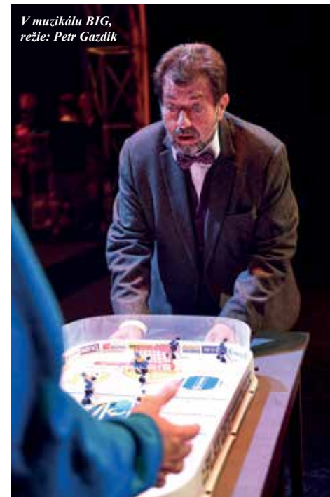
V muzikálu BIG, režie: Petr Gazdík