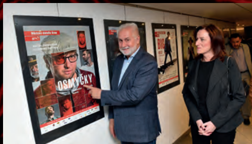
Jednu z repríz navštívil hejman Jihomoravského kraje Bohumil Šimek.