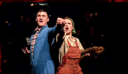
Sté výročí republiky jsme oslavili koncertem VIVA „LALALA“ REPUBLIKA 28. října.