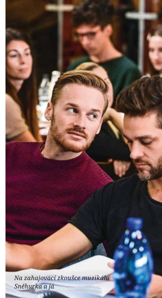
Na zahajovací zkoušce muzikálu Sněhurka a já

Změnil se mu zcela život. Přesídlil do Brna, kde se najednou cítil mnohem lépe. Vyhovovala mu ona pověstná „vesnická“ velikost našeho města. Byl příjemně překvapen velkou spoustou mladých lidí, studentů, kteří v Brně žijí, a těšil se na uvolněná studentská léta na umělecké škole. Brzy byl však ze svého omylu vyveden. Rozvrh hodin byl nabitý k prasknutí a většinou končil až ve večerních hodinách. Když se k tomu připočítají nezbytné přesuny v rámci různých budov školy, zjistil, že mu na nějaké veselé večírky mnoho času (a hlavně sil) nezbyvá. Zvykal si na velkou přísnost a řád školy a zároveň velmi rychle pochopil, že je to samozřejmě jen ku prospěchu jeho samotného, ale i všech studentů. Pochopil, že herec musí disponovat velkou pílí, pokorou a sebekázní. V průběhu studií nastudoval mnoho titulů, za všechny jmenujme absolventské