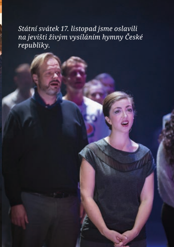
Státní svátek 17. listopad jsme oslavili na jevišti živým vysíláním hymny České republiky.