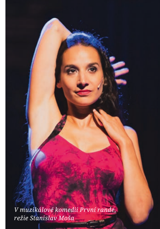
V muzikálové komedii První rande, režie Stanislav Moša

Vůbec ne. Na JAMU jsem nic takového nehrála, to přišlo až u nás v divadle. A řeknu ti přesně kdy – když jsem zkoušela Glorii ve Flashdance . To bylo vůbec báječné zkoušení: cokoli jsem udělala, cokoli jsem vymyslela, bylo dobře! Hrozná svoboda, kterou jsem dřív nezažila a která se ještě zopakovala v Noci na Karlštejně a s Odou Mae v DUChovi . Normálně touhle otázkou začínám, u tebe s dovolením skončím: jak ses vůbec dostala k herectví?