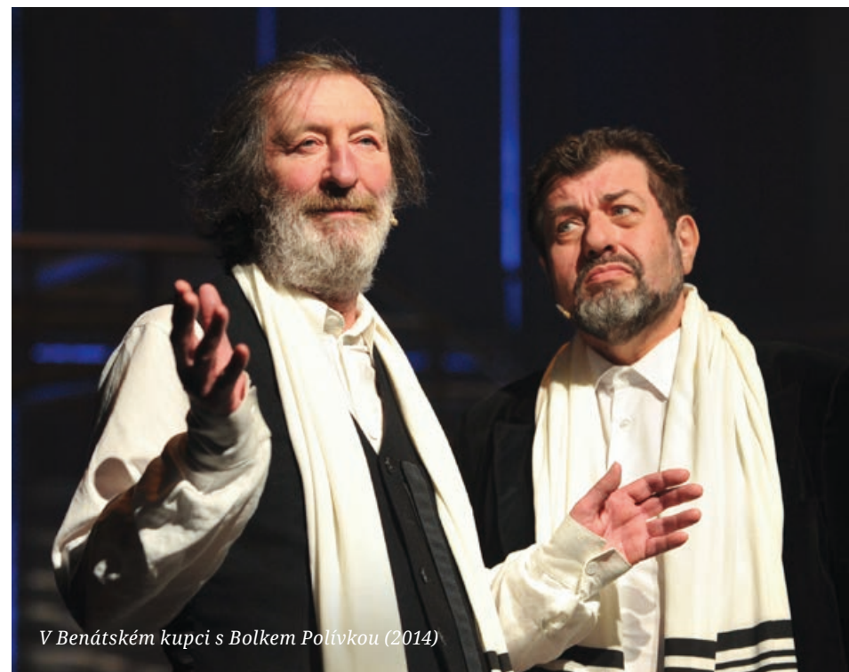
V Benátském kupci s Bolkiem Polívkou (2014)