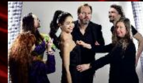
Nafotili jsme plakát k Antoniově a Kleopatře.