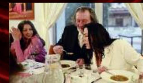
Na slavnostním obědě v restauraci Boulevard na naši dvoraně se novomanželé nevyhnuli tradici společné "polívky".