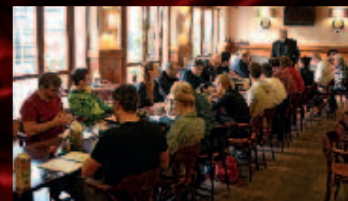
... i klasické Shakespearovy tragédie Antonius a Kleopatra.