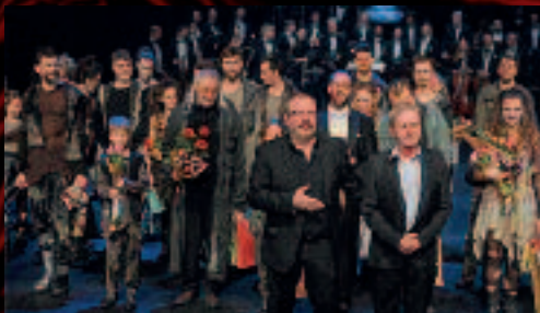
Na Hudební scéně se 8. února odehrála světová premiéra muzikálu Ráj autorů Stanislava Moši a Zdenka Mery.