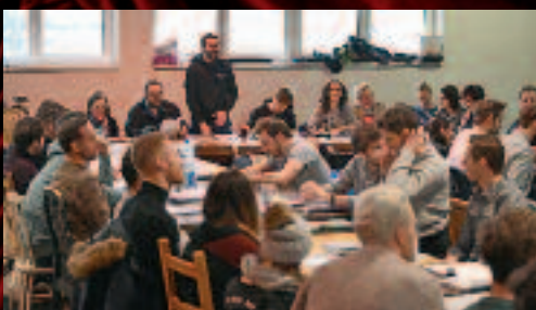
Záhyby po rajských premiérách jsme se pustili do zkoušení nového muzikálového titulu Grand Hotel...