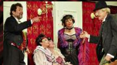
Dne 30. dubna jsme oslavili 20 let od prvního uvedení této inscenace.