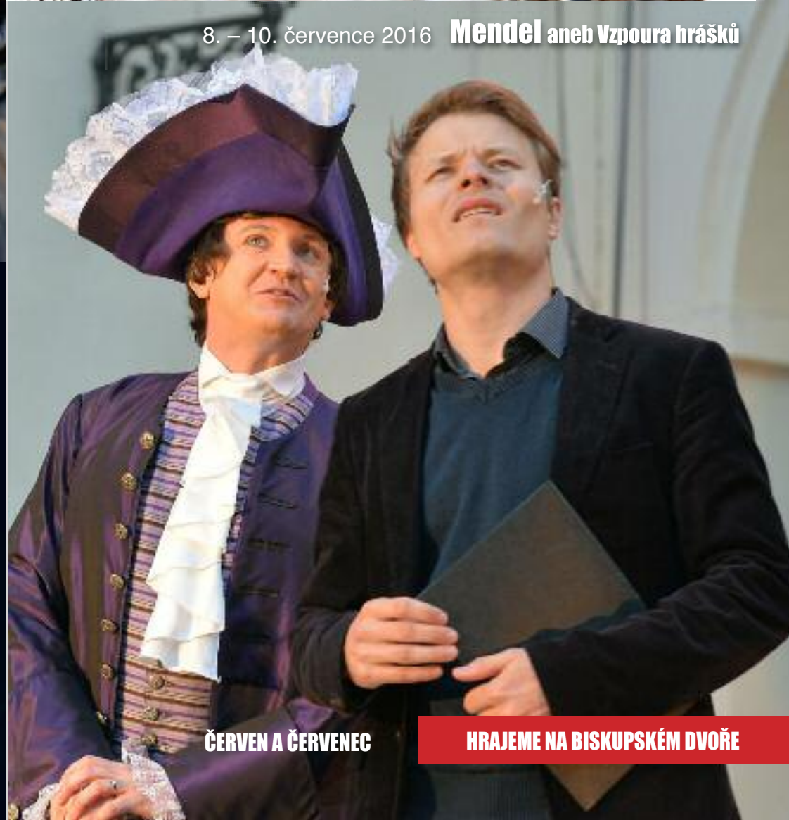
8. – 10. července 2016 Mendel aneb Vzpoura hrášků