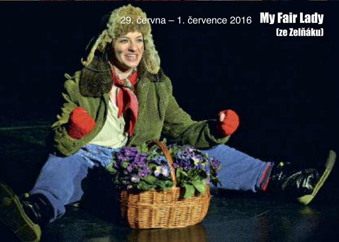
29. června – 1. července 2016 My Fair Lady (ze Zelňáku)