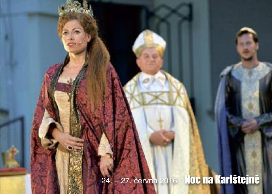
24. – 27. června 2016 Noc na Karlštejně