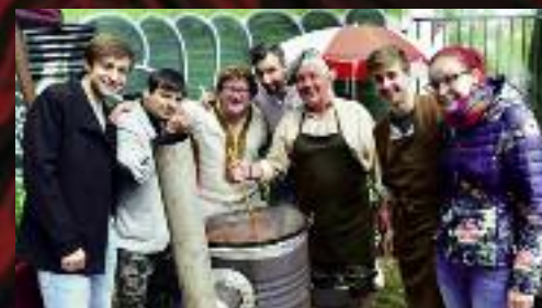
Tenisový kurt v Lužáneckém parku se stal dějištěm již druhého ročníku Guláš Festu Brno.