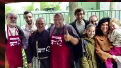
V soutěžním klání o nejobtnější guláš uvařený na místě se utkaly také týmy našeho divadla.