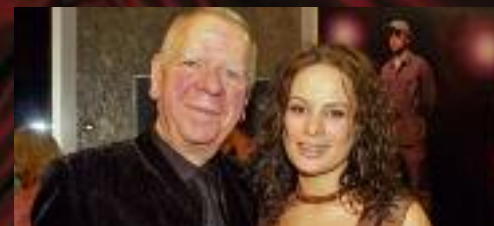
Dne 28. července oslaví spisovatel, dramatik a v neposlední řadě politik Milan Uhde osmdesáté narozeniny, na snímku s Jitkou Čvančarovou ve foyer Hudební scény MdB.