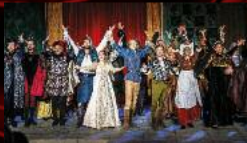
Premiérové nadšení neprobíhalo jen na jevišti, ...