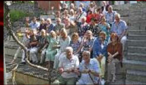
Na sklonku se sezóny se sešli i naši důchodci.