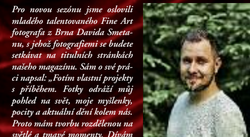
Pro novou sezónu jsme oslovili mladého talentovaného Fine Art fotografa z Brna Davida Smetanu, s jehož fotografiemi se budete setkávat na titulních stránkách našeho magazínu. Sám o své práci napsal: „Fotím vlastní projekty s příběhem. Fotky odráží můj pohled na svět, moje myšlenky, pocity a aktuální dění kolem nás. Proto mám tvorbu rozdělenou na světlé a tmavé momenty. Dívám se na svět kouzelným okem fotoaparátu. V tu chvíli se čas zpomalí a jsem tu jen já, můj fotoaparát a magické okamžiky k zachycení.“