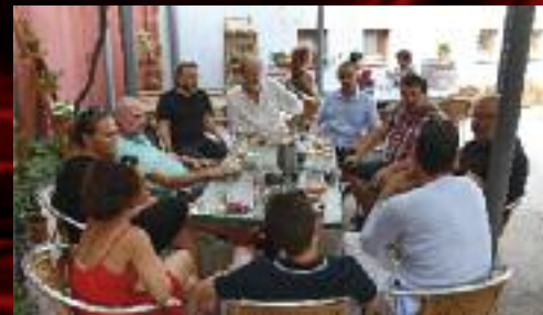
... i v klubu...