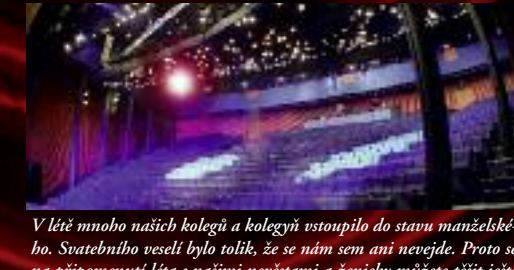
V létě mnoho našich kolegů a kolegyně vstoupilo do stavu manželského. Svatebního veselí bylo tolik, že se nám sem ani nevejde. Proto se na připomenutí léta s našimi nevěstami a ženichy můžete těšit ještě v říjnovém čísle. Zároveň v říjnu oslavíme 15 let od otevření Hudební scény. K tomuto jubileu vyjde i speciální číslo Dokořánu . Máte se na co těšit!