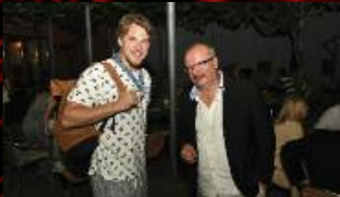
... a poblahopřát k premiéře přišel i Vojtěch Dyk.