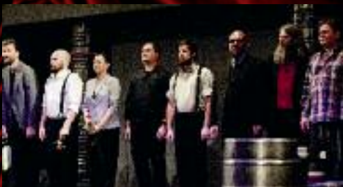
Kabaretní sferie Osmyčky získala na divadelním festivalu Bez hranic v Českém Těšíně hlavní cenu Zlomená závora . O vítězi rozhodli v hlasování samotní diváci. Gratulujeme!