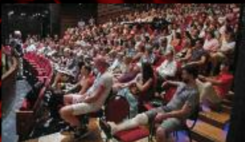
Na závěr sezóny se sešli všichni zaměstnanci v divadle...