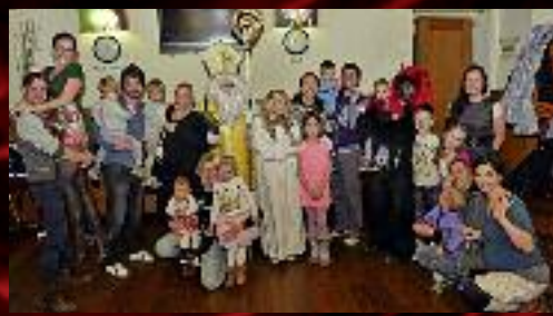
Můžeme se těšit zase letos v prosinci.