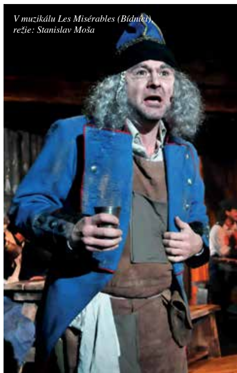
V muzikálu Les Misérables (Bídňáci) režie: Stanislav Moša