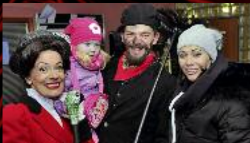
V prosinci 2016 navštívila Hudební scénu Mary Poppins, pravděpodobně naposledy.