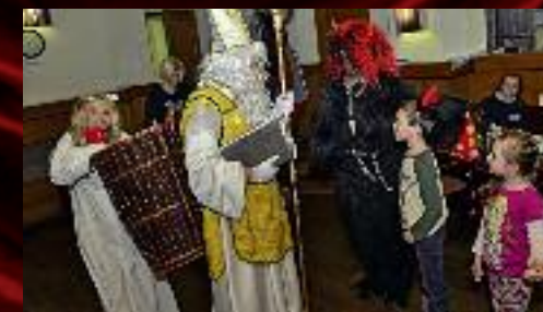
Ale básničky měly připravené na výbornou.