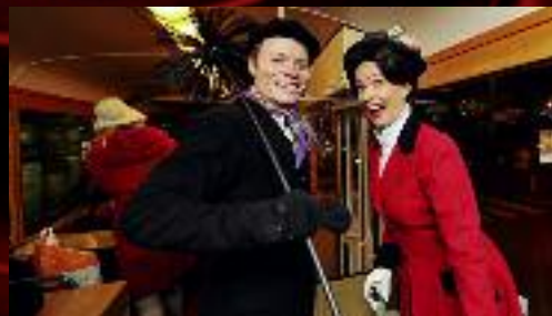
Kouzelná chůva si přišla pro štěstí před vystoupením na náměstí Svobody.