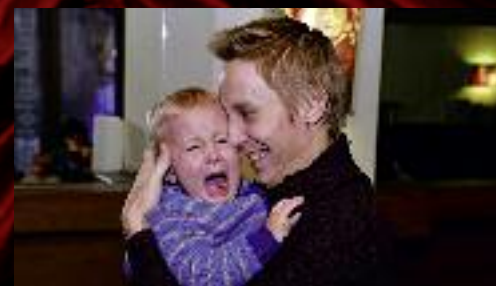
Jiné děti pořádně vystrašil čert.