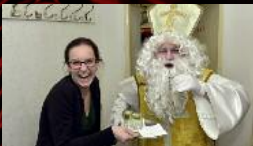
Zachoval se jako uličník a hned ve dveřích se osvěžil panáčkem.