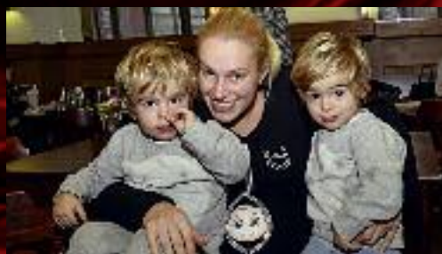
Některé děti byly jeho návštěvou nadšené.