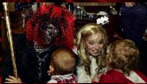
A s andělem si všechny rozuměly.