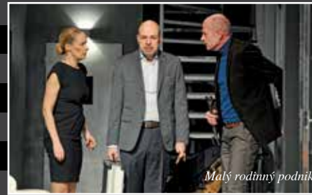
Malý rodinný podnik