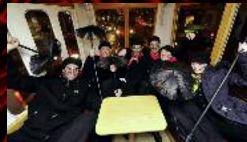
Propagační jízdu brněnskou šalinou si užili i komičti kamarádi.