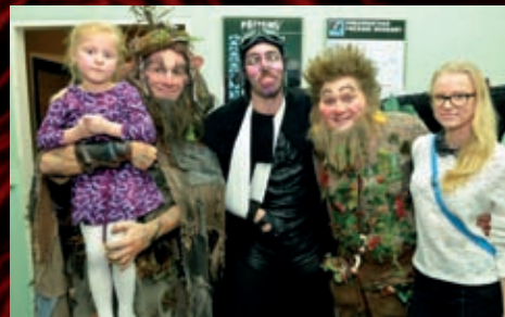
Za jevištěm Hudební scény se s hvězdami muzikálu Let snů LILI vyfotily jejich fanynky.