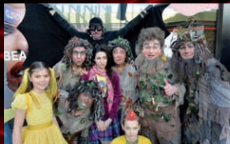
Náš pobádkové bytosti zazpívaly návštěvníkům Olympie několik písniček z muzikálu Let snů LILI.