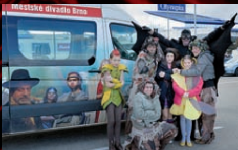
Herecká úderka se vypravila do nákupního střediska Olympie.