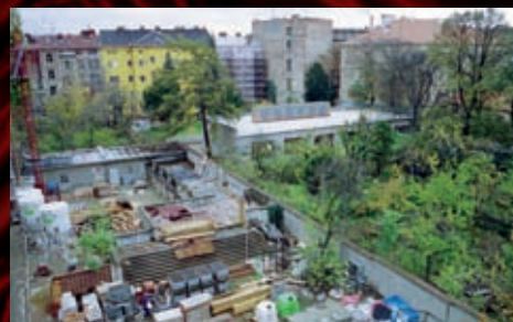
Z archivu – pobled na prostor, kde dnes stojí Hudební scéna, z oken ředitelství divadla, listopad 2011.