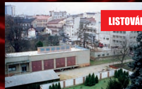
Pobled na místo budoucí stavby z třídy Kpt. Jaroše v listopadu 2011.