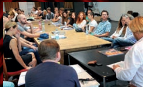
Na pražském uvedení Zorra se budou podílet členové našeho souboru i pražští umělci.