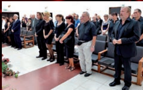
Po pietním aktu na Činoherní scéně jsme naposledy vzdali hold této významné herecké osobnosti v obřadní síni krematoria.