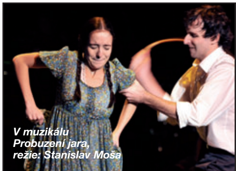
V muzikálu Probuzení jara , režie: Stanislav Moša

Jiří: Forma muzikálu je aktuální, ale není až tak pro-