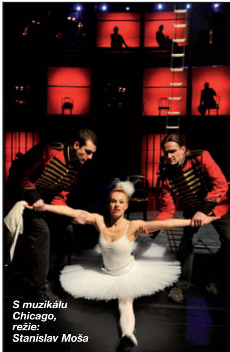
S muzikálu Chicago, režie: Stanislav Moša

Jan Trojan, foto: jeř Kratochvíl, Tino Kratochvíl