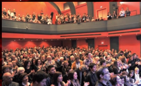
Legendární muzikál Hair v provedení Městského divadla Brno si odbyl premiéru 30. listopadu 2011 na jevišti Stadtteatru ve švýcarském Oltenu.