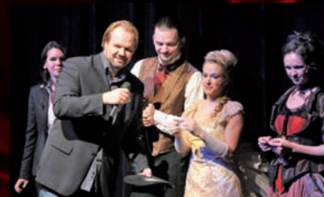
17. listopadu uplynulo 10 let od doby, kdy byl položen základní kámen Hudební scény. Tuto událost jsme si připomněli před představením muzikálu Jekyll a Hyde.