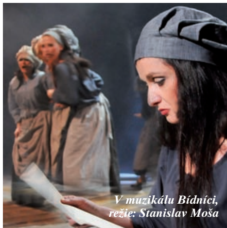
V muzikálu Bídničci, režie: Stanislav Moša

Nechtěli bychom, aby byl jedináček, ale ne-