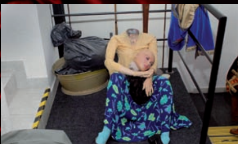
Ztrafit hlavu je velmi ošidné, tu jde naštvít jen o komparzistku z komedie Měsíční kámen.