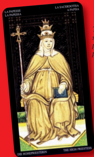
Tarotová karta s figurou papežky prý znamená problémy