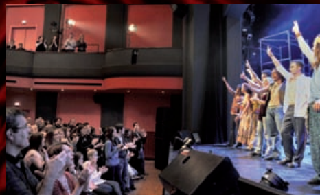
Po velmi zdařilé premiéře ve Švýcarsku inscenace (režie Stanislav Moša) absolvoje evropské turné.