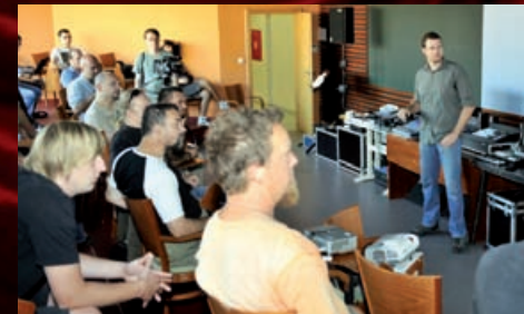
Ve všech divadelních prostorách probíhalo během měsíce září za podpory EU školení zvukových mistrů.