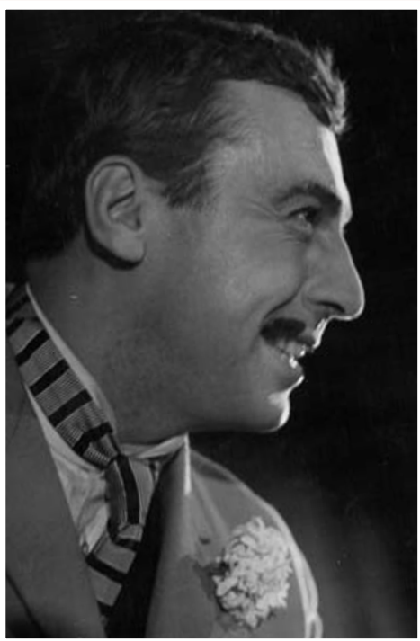
V roli Mackieho Messera. Opera za pár grošů, DbM 1961