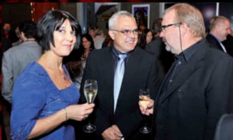
Společenská setkání po premiéře muzikálu Kráska a zvíře.