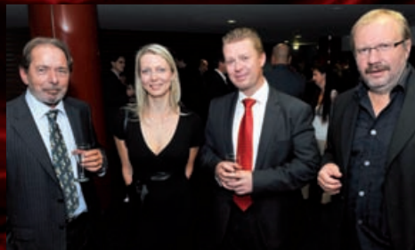
Brněnská plynárenská v čele se svým generálním ředitelem zakoupila pro své zaměstnance a příznivce muzikál Kráska a zvíře.