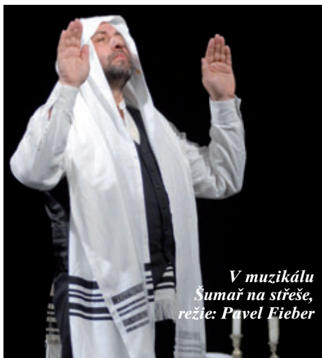
V muzikálu Šumař na střeše, režie: Pavel Fieber

tých letech v učitelských sborech nepanovala móda zcela vystříhaných hlav. Profesori nebyli holohlavi pokud nemuseli. Vystříhal jsem se před lety kvůli Othellovi a potom mi to zůstalo v Četnických humoreskách . Lidé si zvykli až tak, že mi nyní říkají, zda jsem si nechal narůst vousy. Ty mám odjakživa, jen mi k nim nyní přibýly i vlasy. Šediví mi ale právě jenom bíbr, u nás v rodině na stříbrné vlasy moc nedochází.