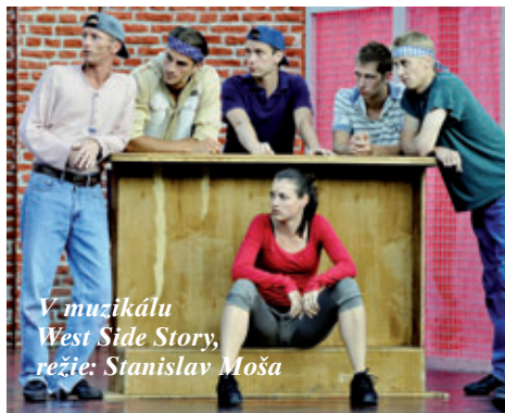
V muzikálu West Side Story , režie: Stanislav Moša