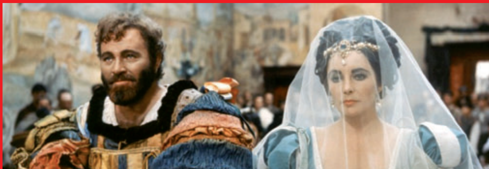
Zřejmě nejslavnější Petruccio a Kateřina 20. století – Richard Burton a Liz Taylorová ve filmu Franca Zeffirelliho

Všichni v Padově by chtěli krásnou, milou a pokornou Bianku, dceru pana Battisty, zejména pak romanticky rozdychtěný Lucenzio. Smůla všech smůl – pan Battista trvá na tom, že nejdřív musí provdat svou starší dceru Kateřinu. Ta je však pro svou hubatost, aroganci a neposlušnost naopak postrachem mužů a nápadníci se právem obávají, že ji nikdy nikdo za manželku chtít nebude. A právě proto by se nikdy nemohla vdát ani Bianka. To ovšem nemohou připustit! Seženou a zaplatí tedy Kateřině ženicha – užvaněného, chlubitivého a světem protřelého frajířka jménem Petruccio, který tuto dračici v sukních vskutku „zkrotí“. Nebo zkrotí zároveň ona jeho? A kdo bude nakonec větší saní? Bianka, nebo Kateřina? Není už zřejmě třeba psát dál – stačí konstatovat Zkrocení zlé ženy , jedna z nejlepších a nejvůvážnějších komedií největšího dramatika všech dob Williama Shakespeara se vrací po osmadvaceti letech na prkna Městského divadla Brno.