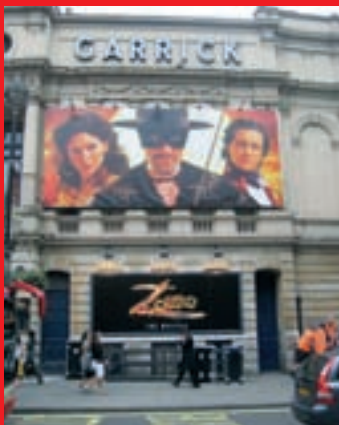
Zorro v Londýně

Bude tomu zanedlouho už sto let, kdy si roku 1919 americký autor brakových románů na pokračování Johnston McCulley vymyslel pro svůj časopisecký cyklus Capistranovo prokletí postavu Diega de la Vegy, neohroženého španělského šlechtice a brilantního šermíře žijícího v Kalifornii, který prosazuje pod černou pláštěnkou a kryt maskou spravedlnost a zákon. Muž skrytý pod maskou je pak nazýván svým okolím „lišákem“ – el Zorro! McCul-