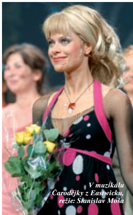
V muzikálu Čarodějky z Eastwicku, režie: Stanislav Moša

Je fakt, že se denně píše o podobných skutcích zoufalých žen. Sama si to neumím ani představit, čelit takovému rozhodnutí. Pevně doufám, že mě nic podobného nepotká jinde než na jevišti.