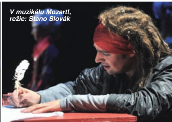
V muzikálu Mozart! , režie: Stano Slovák