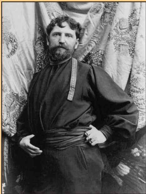
Alfons Mucha v Paříži