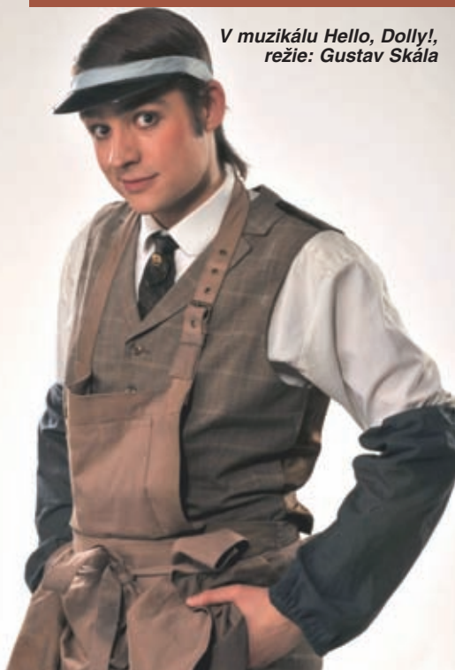
V muzikálu Hello, Dolly!, režie: Gustav Skála