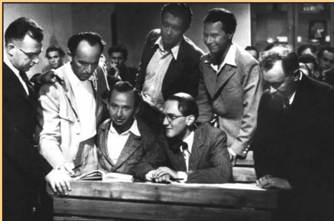
Z natáčení filmu Škola základ života ; zleva: autor Jaroslav Žák, režisér Martin Frič, R. A. Strejka (Holous), František Filipovský (Krhounek), Antonín Novotný (Benetka), Ladislav Pešek (Čuřil) a Václav Trégl (matikář Kodbusek)